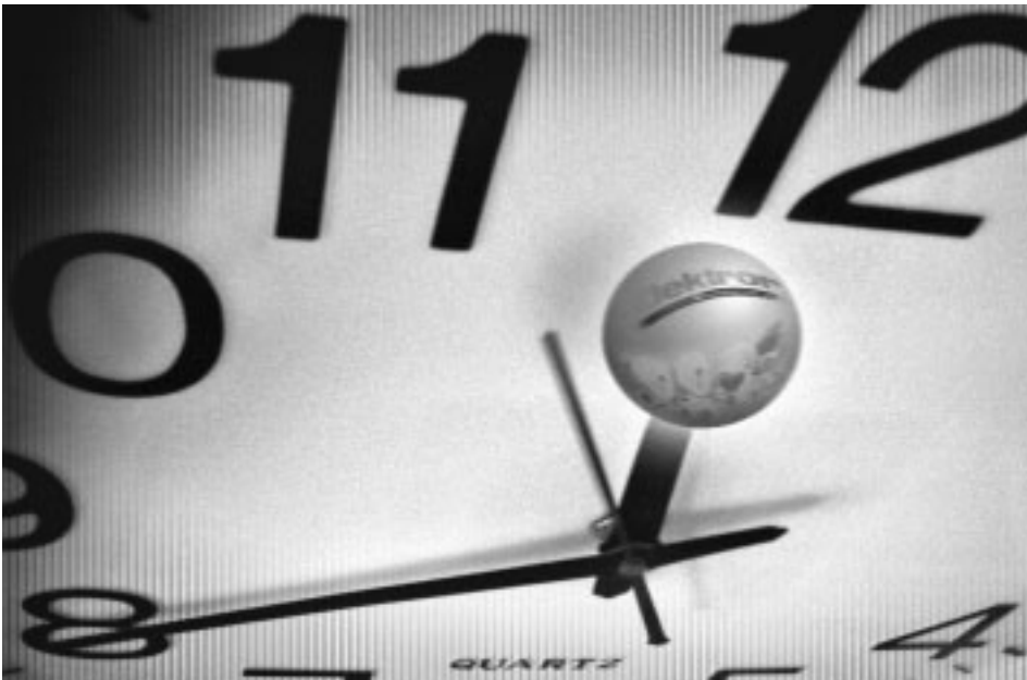
Zeit ist Geld – und mit dem Customer Support können Elektron-Kunden eine Menge Zeit sparen.

Elektron startet mit einer neuen Customer Support Abteilung.